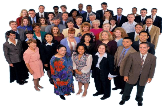
Cultura y Clima Organizacional