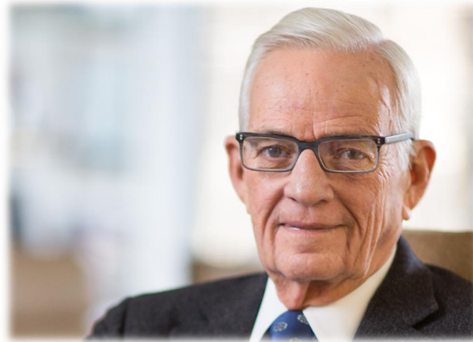
Paul O'Neill a los grupos de interés en el año 1987

“Centrarse en la seguridad de las personas puede transformar toda una organización y mejorar drásticamente la cultura, la calidad, la productividad, la comunicación y, en última instancia, las ganancias”.